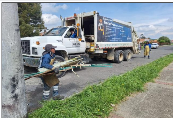
Ilustración 3. Recolección por parte de la EMAAF.