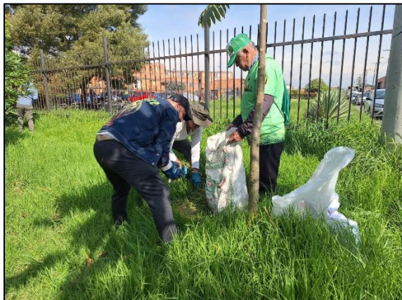
Ilustración 2. Levantamiento de residuos.

C.P 250020 Tel. (601) 8234070 823 40 71 / 823 40 73 Fax. (601) 8257620 Dir. Cra. 14 No. 13-05